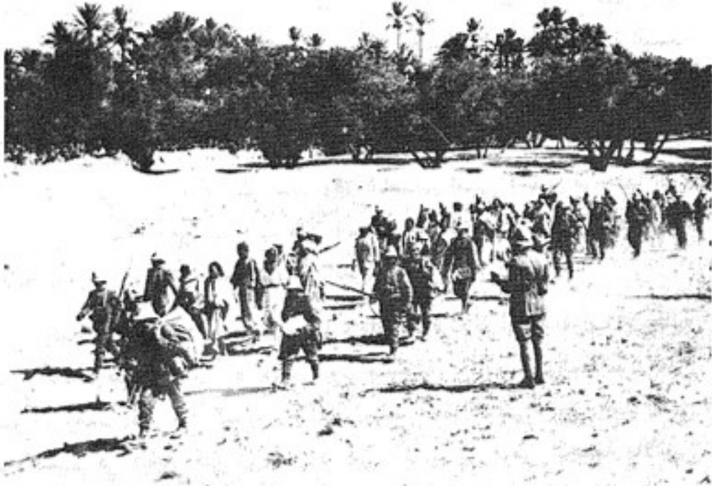
صورة توضح طائفة من العرب في طريقهم الى التصفية الجسدية.

وقد ذكر شاهد عيان إنجليزي حسن الإطلاع في مجلة (بلاك وودرز مجازين) في عددها الصادر في ديسمبر ١٩١١ بأنه «صدرت الأوامر بتطهير الواحة فوراً وأن كل العرب الذين توجد في أيديهم أسلحة، أو الذين يبدو من أي دليل أنهم كانوا مشتركين في الثورة يجب أن يعدموا دون إبطاء. وكانت الأوامر غامضة، وغير دقيقة وعامة، بحيث تسمح بإعطاء درس قاس ومفيد، حيث إنه سبق تحذير العرب بإعلان أن حيازة بندقية سوف تعتبر جريمة كبرى.